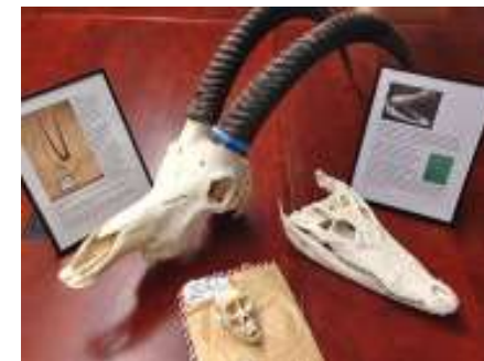
Cráneos de antílope sable, monos y cocodrilos de Siam adquiridos en eBay.

Utilización en remedios medicinales tradicionales