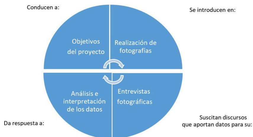
Fig. 2: Representación de las etapas básicas del proyecto