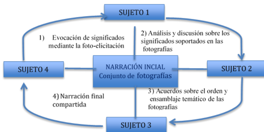
Fig. 1. La producción de la narración fotográfica en el grupo de discusión