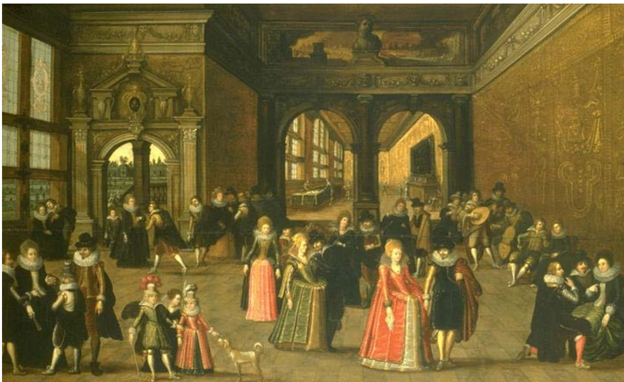
Baile en la corte de Enrique IV (siglo XVI),