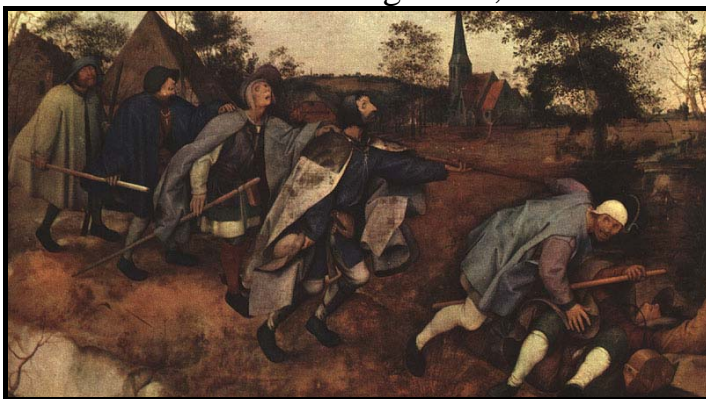
Peter Brueghel, parábola del ciego (1568).

Los pequeños son el grupo más numeroso de la población: jornaleros, artesanos, mano de obra no cualificada en general, etc.