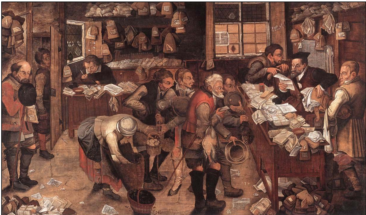
Peter Brueghel, El abogado de la villa (siglo XVI).