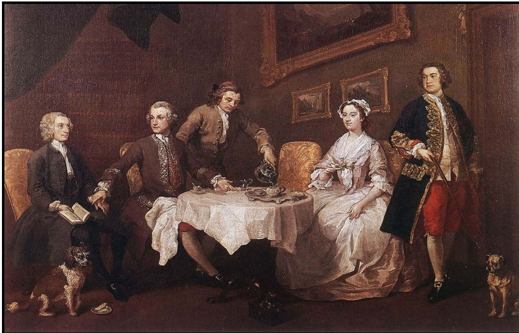
Hogarth, La familia Strode (Inglaterra, 1738).

El matrimonio es tardío, primando los intereses de la familia sobre los individuales.