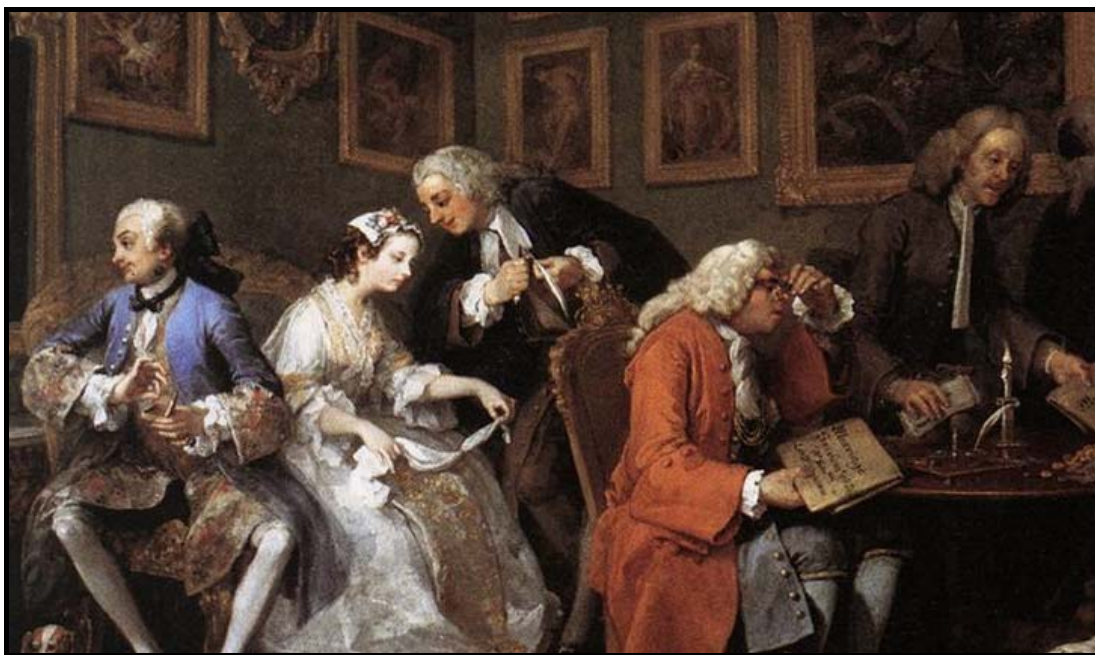
Hogarth, Matrimonio a la moda (Inglaterra, 1743)

El matrimonio es tardío, primando los intereses de la familia sobre los individuales.