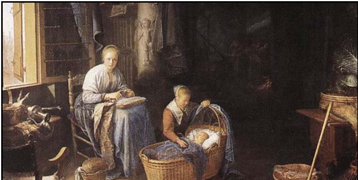
Gerrit Dou, Joven madre (Holanda, 1658)

Es muy debatido el papel de la infancia durante este período, y según Philippe Ariés las relaciones entre padres e hijos eran más protocolarias que afectivas