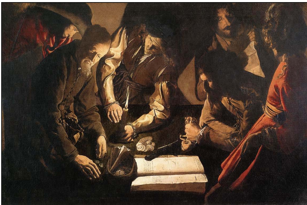
La Tour, El pago de las deudas (1630).

En realidad, al menos en Francia, no hay una contraposición tajante entre nobleza y burguesía: " salvo en algunas provincias ariscas y atrasadas, el verdadero corte no