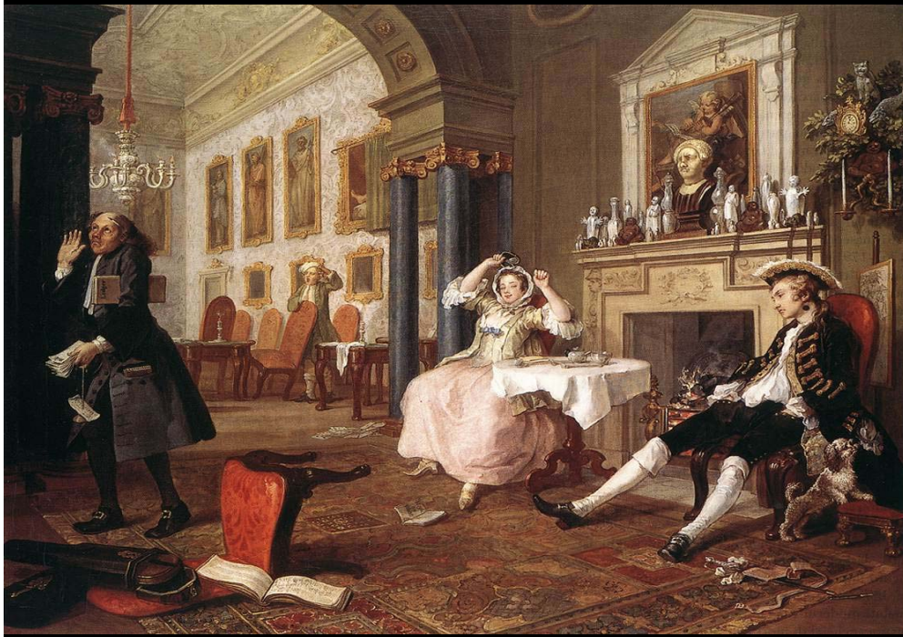
Hogarth, Matrimonio a la moda (Inglaterra, 1743).

Durante este período prima el modelo monárquico de familia, si bien a partir de los siglos XVII y XVIII comienzan a notarse una serie de cambios.