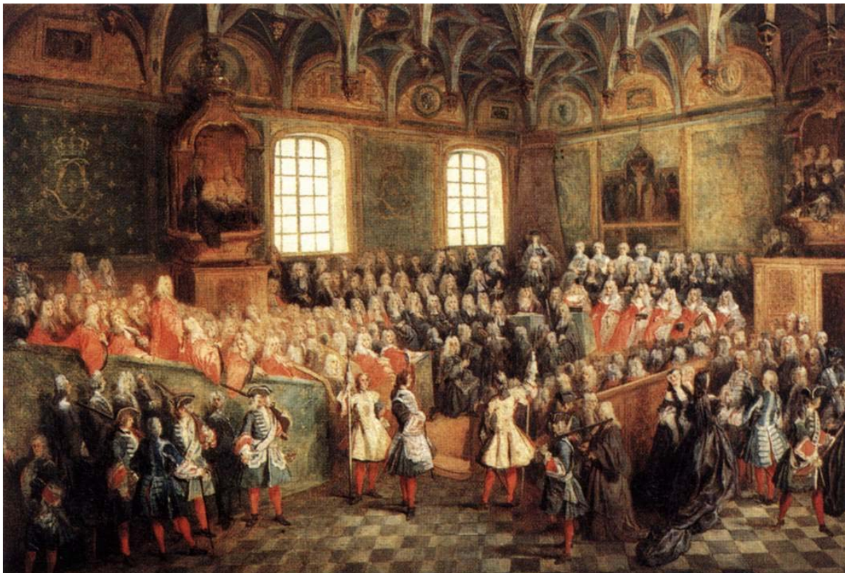
El parlamento de París (siglo XVIII).

La nobleza francesa. Podemos clasificar la nobleza francesa, según su antigüedad, en nobleza antigua y nueva nobleza. A la cabeza de la primera se encuentran los Grandes . Hay una importante nobleza parlamentaria . Y una baja nobleza de gentilhombres campesinos.