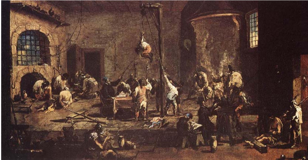
Alessandro Magnasco, Interrogatorios en la cárcel (1710).

La violencia estaba muy generalizada durante este período y respondía a las frustraciones de las clases populares y sus precarias condiciones de vida. Los castigos eran duros, y la tortura frecuente.