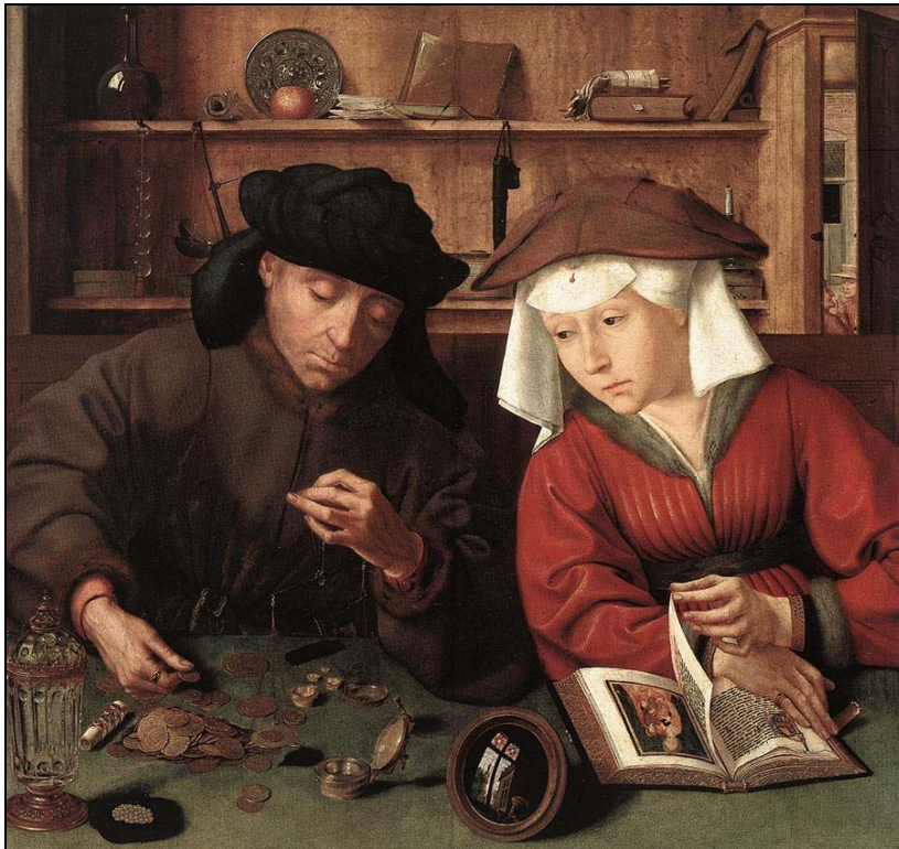
Quentin Massys, El cambista y su esposa (1514).