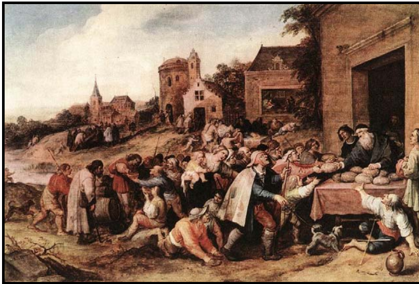
Francken, Las siete obras de misericordia (siglo XVI).

Pero en el siglo XVI esta visión comienza a cambiar, influyendo mucho la obra de Luis Vives De subventionem pauperum (Brujas, 1526).