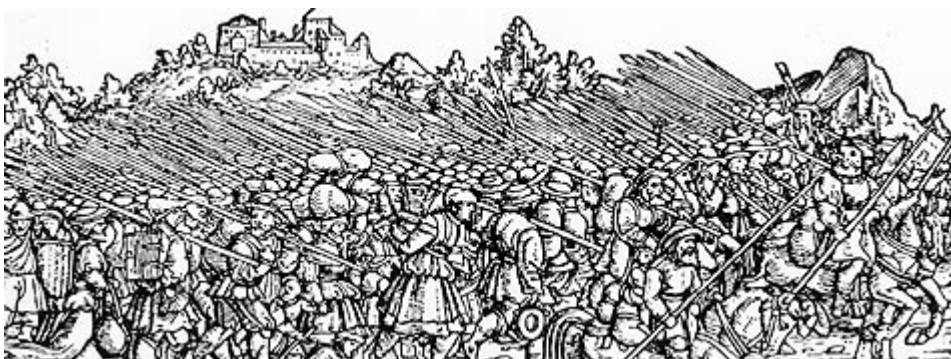
Rebelión de los campesinos alemanes (1525).