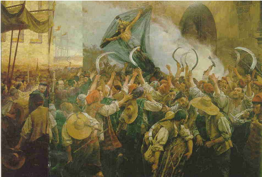
El Corpus de sangre de 1640, pintura del siglo XIX.

Suelen carecer de una ideología y cuando ésta existe suele ser muy conservadora y de carácter religioso, destacando tres grandes mitos.