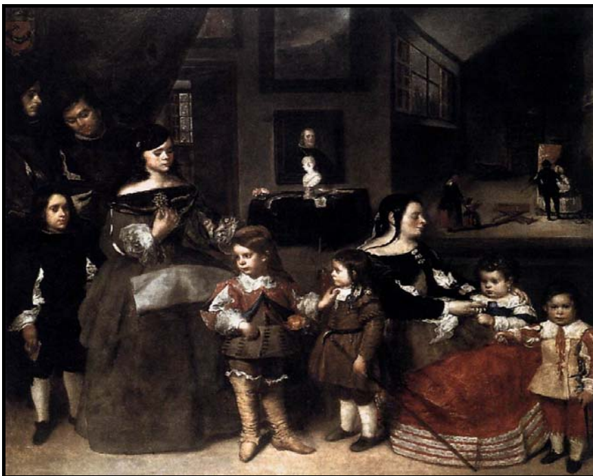
Martínez del Mazo, La familia del artista (España, 1660).

— Estas diferencias se deben a factores jurídicos (el régimen hereditario) y sociales.