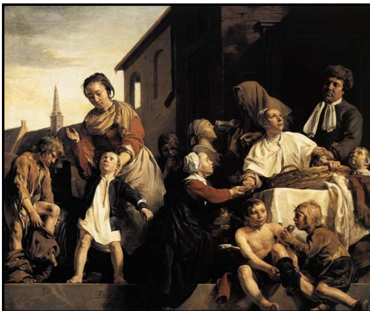
Jan de Bray, Orfanato de Haarlem (siglo XVII).

El siglo XVIII continúa con la misma actitud.