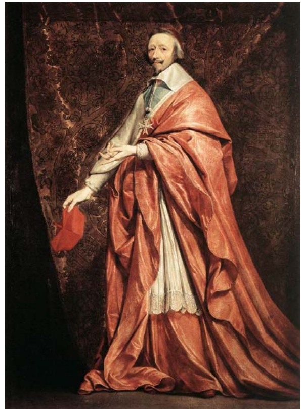
Philippe de Champaigne, Luis XIII y Richelieu.