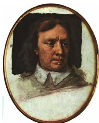
Oliver Cromwell (1657).

*En 1645 Oliverio Cromwell se convierte en jefe del ejército parlamentario, derrotando a las fuerzas realistas. Carlos I será ejecutado (1649). “ El dicho Carlos Estuardo, elevado al trono de Inglaterra, había sido en consecuencia revestido de un poder limitado para gobernar...con la intención perversa de erigir en su persona un poder ilimitado y tiránico que le pusiera en estado de gobernar conforme a su voluntad, y de destruir los derechos y libertades del pueblo...tanto él como sus adictos...han tomado las armas traidora y maliciosamente contra el presente Parlamento ” (Acta de acusación contra Carlos I, 1649).