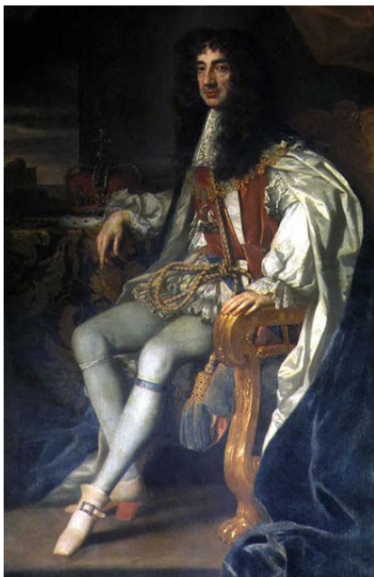
Carlos II 2. FRANCIA.

*Durante el reinado de Ana, hija de Jacobo II (1702-1714), se produce el Acta de Unión (1707) con Escocia.