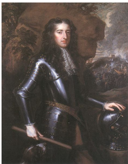
Guillermo III de Orange.

*En 1672 es asesinado Juan de Witt y se impone de nuevo el Estatuder Guillermo III, que en 1689 se convierte en rey de Inglaterra.