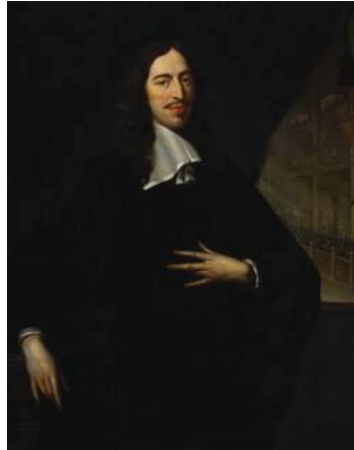
Johann de Witt.

*Ejecución de Oldenvarnevelt (1619) y predominio del Estatuder.