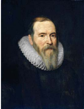
Johan van Oldenbarnevelt.

Poco a poco el pensionario de Holanda se convierte en el Gran pensionario, cargo desempeñado por Jan van Oldenbarnevelt en 1586-1619, en tanto que el estatuderato de Holanda y Zelanda (y luego de Groninga y Drenthe) se encuentra en manos de Mauricio de Orange-Nassau, hijo de Guillermo de Orange (fautor de la rebelión contra los españoles). La historia de las Provincias Unidas vendrá dominada por el enfrentamiento entre el Gran Pensionario y el estatuder.