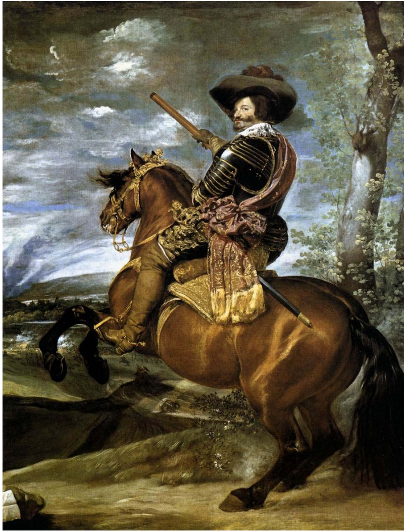
Velázquez, El Conde Duque de Olivares (1634).

*En Cataluña la revuelta desemboca en la integración en Francia, aunque la monarquía española pudo reconquistar casi todo el territorio. La Paz de los Pirineos de 1659 cedería a Francia el Rosellón y la Cerdaña.