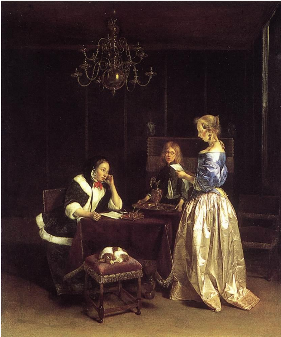
Ter Boch, Mujer leyendo una carta.