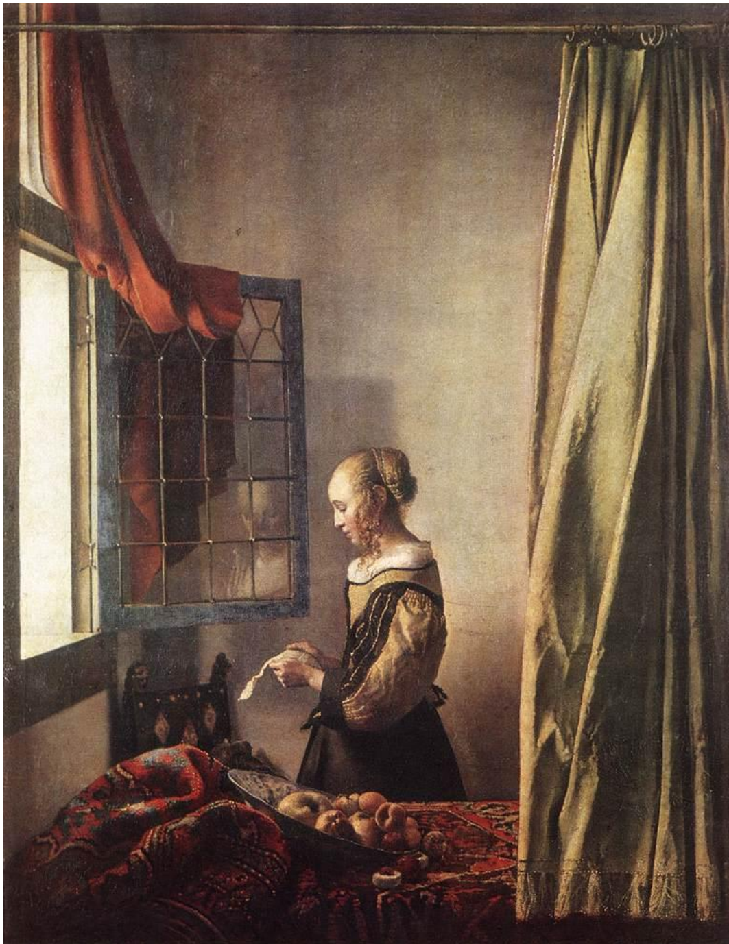
Vermeer, Muchacha leyendo una carta (1657).