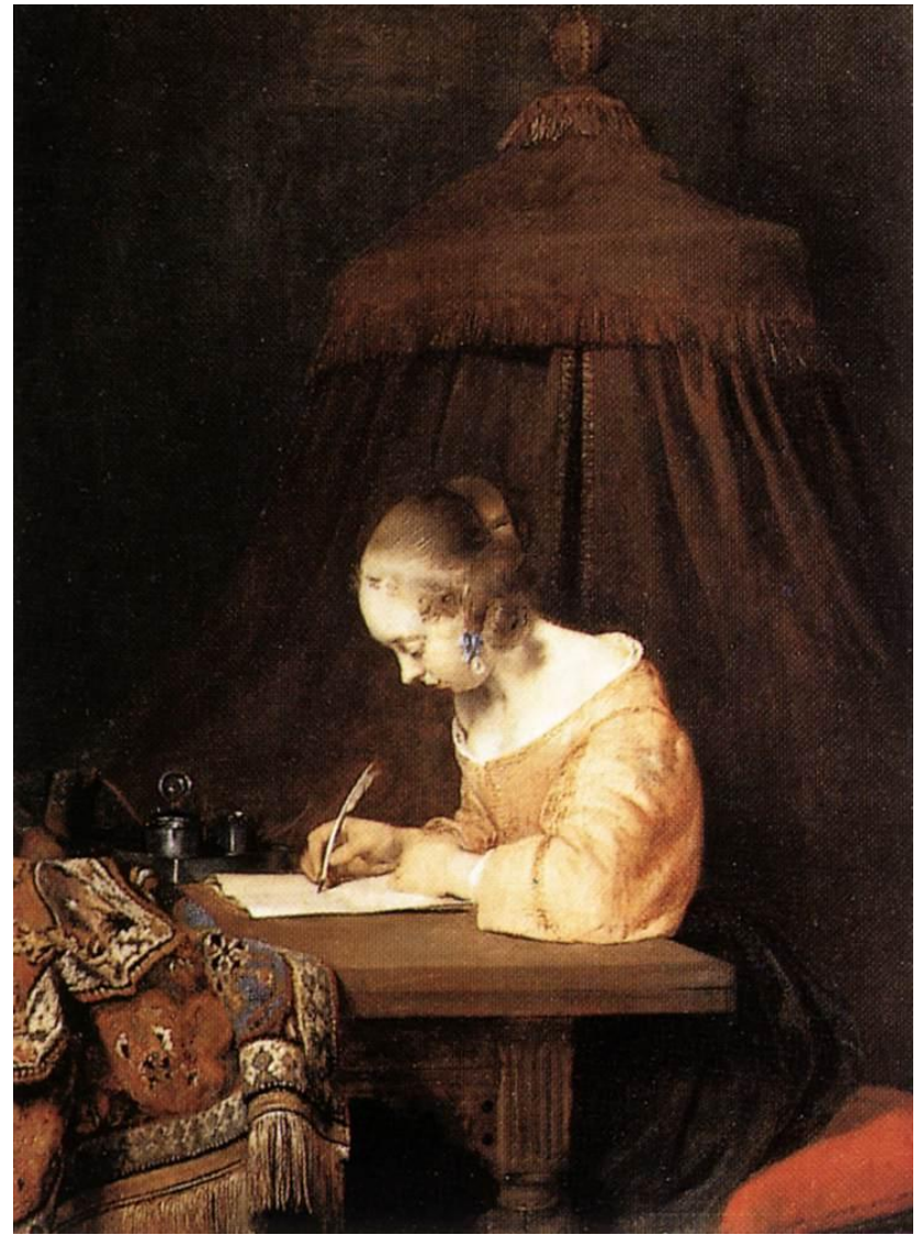
Ter Boch, Mujer escribiendo una carta.