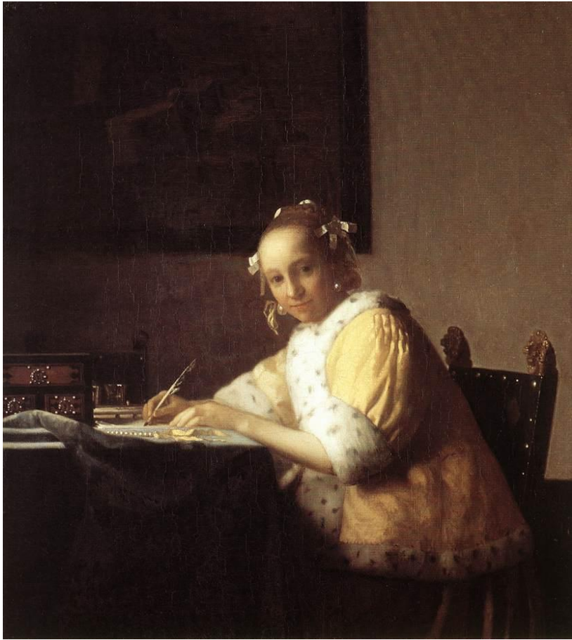
Vermeer, Dama escribiendo una carta (1667 y 1670).