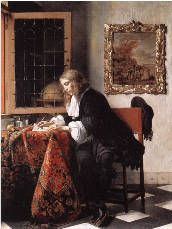
Gabriel Metsu, Hombre escribiendo una carta (1662).