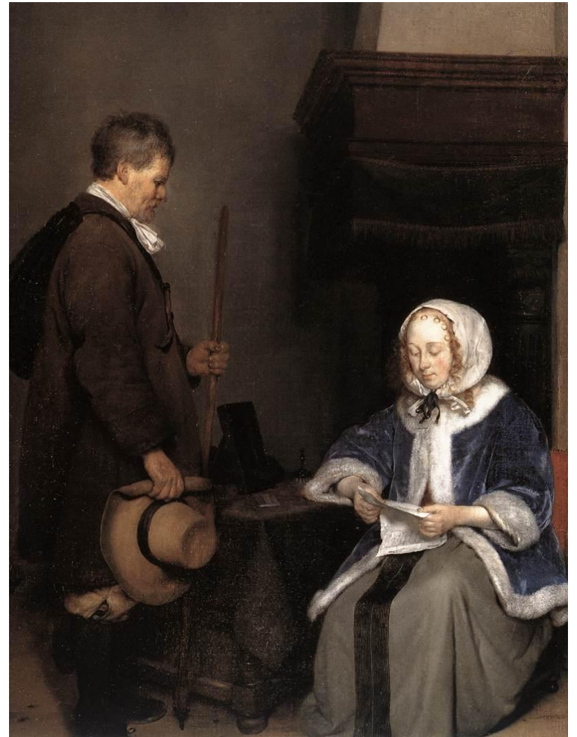
Ter Boch, Dama leyendo una carta.