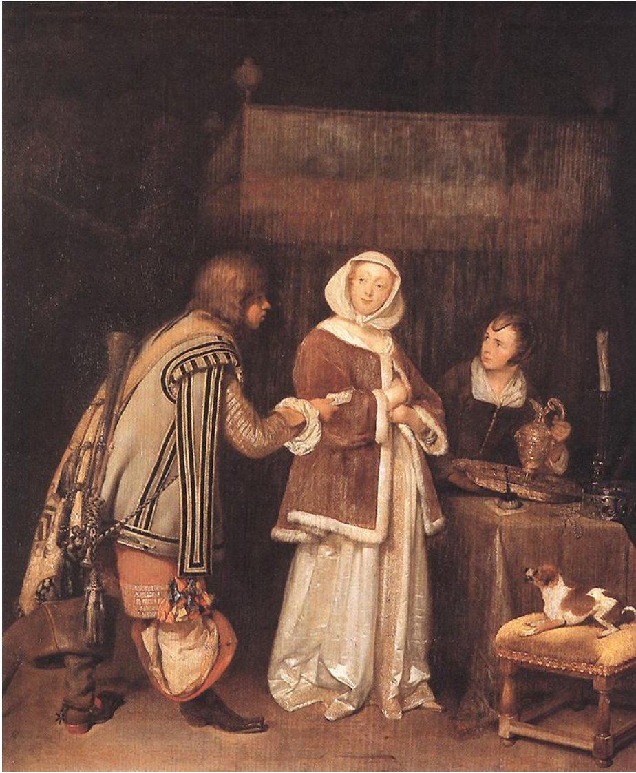
Ter Boch, La carta.