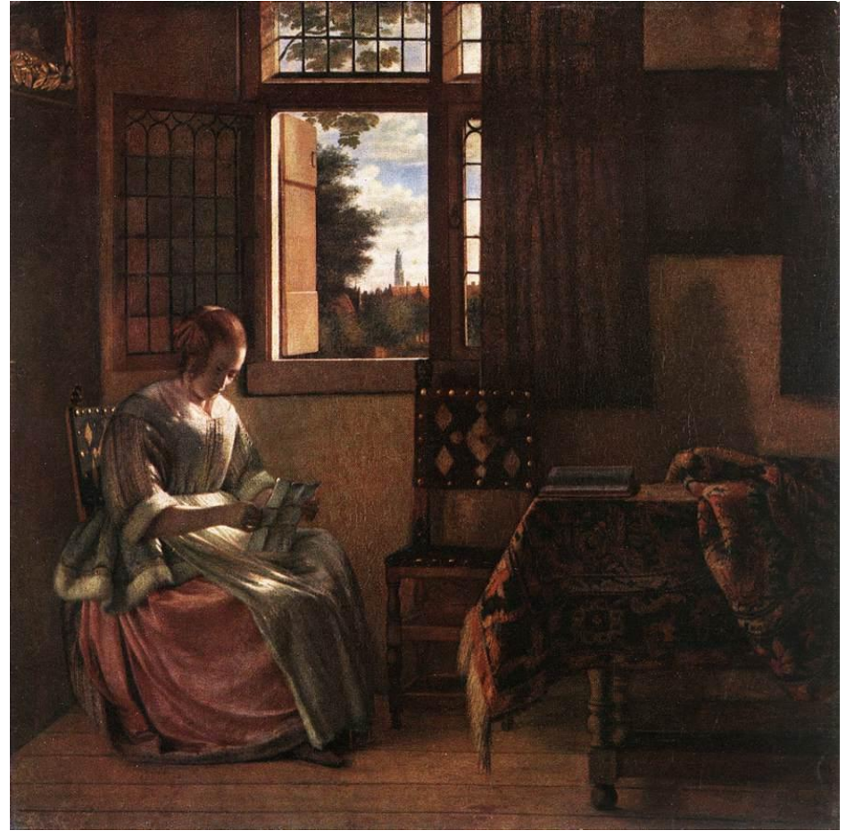
Gabriel Metsu, La escritora de cartas (1662).