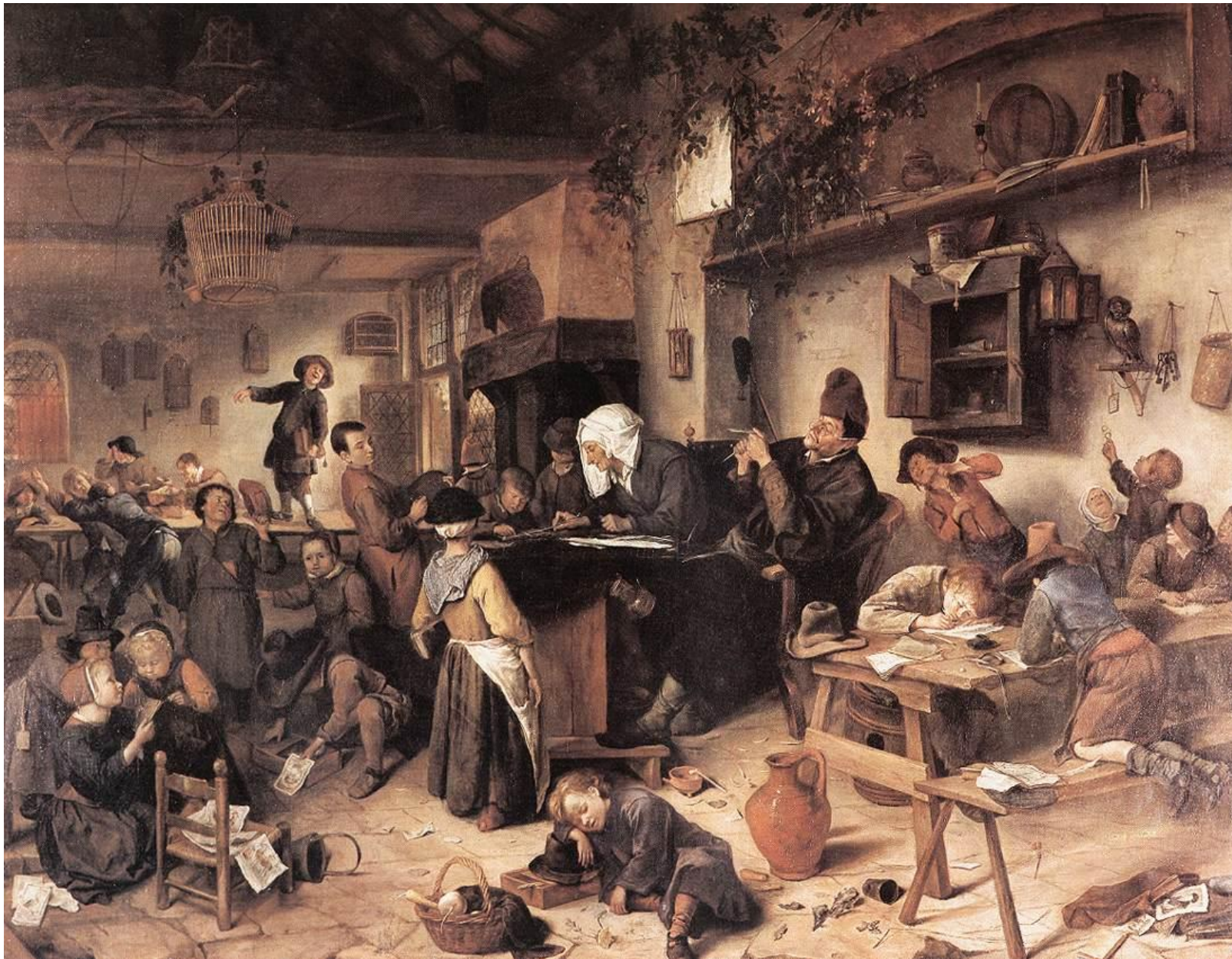
Jan Steen, La escuela del pueblo (1670).