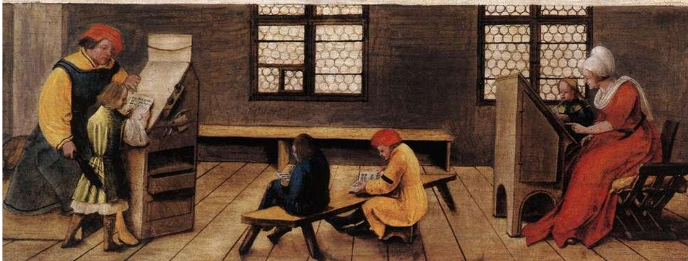
Holbein, Título de maestro (1516).

Wer Jemandt hie Der gern welt lernen Dütlich Ichriben und lalen uß dem aller kürzisten grundt Den Jeman erdencken kan Do durch ein Jeder der vor nit ein büchstaben kan Der mag kürzlich und bald begriffen ein grundt do durch er mag von jm selbs lernen sin schuld uff schribē vud lalen vud wer es nit gelernen kan so ungeschickt were Den will ich v̄m nit vud vergeben gelert haben vud ganz nit von jm zū lon nemen ez sig wer er well burger oder hantwercks ge- sellen frouwen vud juncfkrouwen wer sin bedarff der kum̄ har in der wirt driuwlich gelert v̄m ein zimlichen lon. Aber die junge knabē vud meitlin noch den frouwalten wie gewonheit ist. 1516.