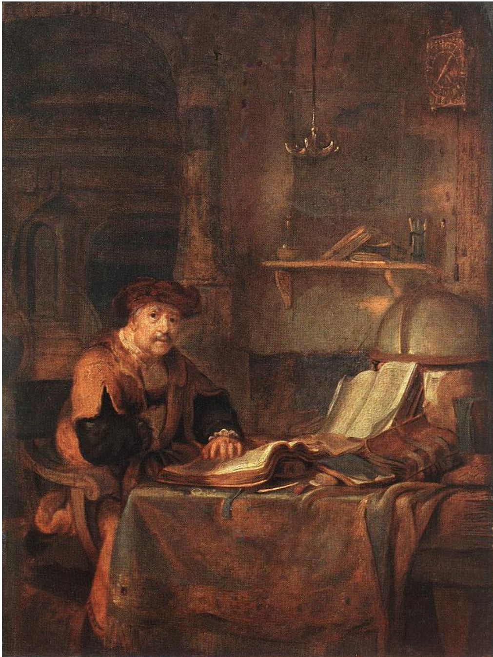
Eeckhout, Profesor con libros (1671).