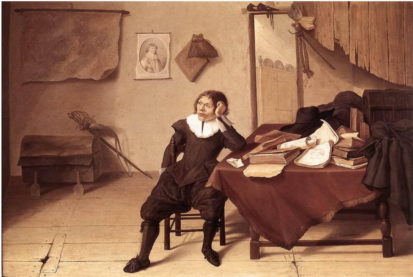
Heem, Estudiante en su estudio (1628).