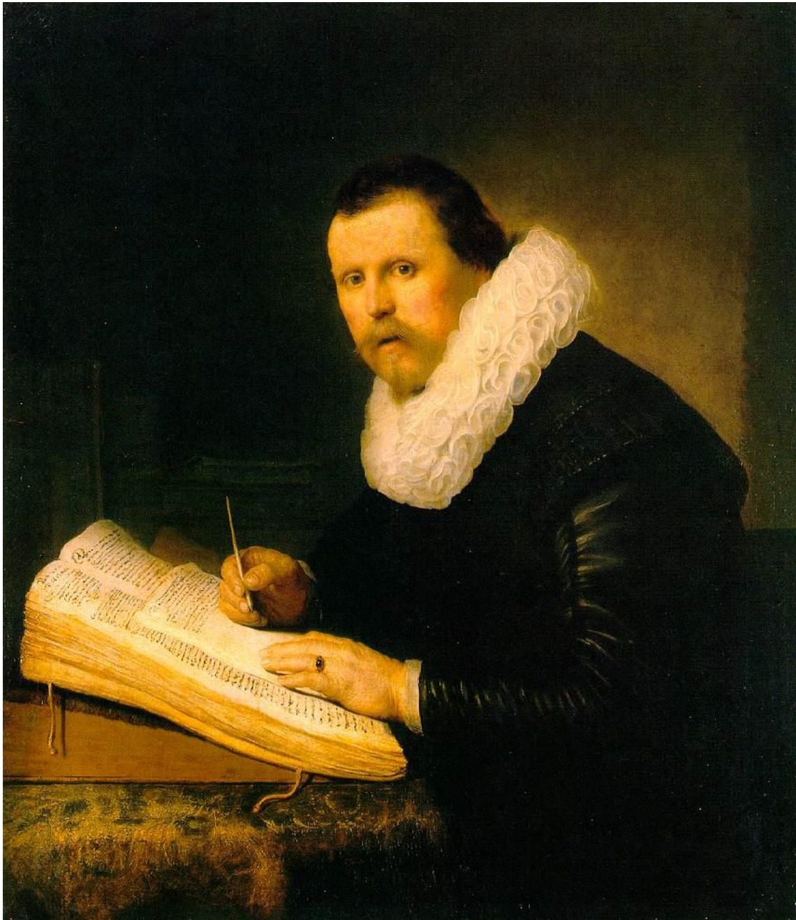
Rembrandt, Profesor (1631).