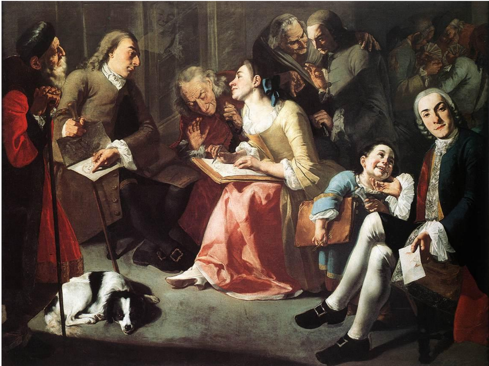
Traversi, La lección de dibujo (1750).