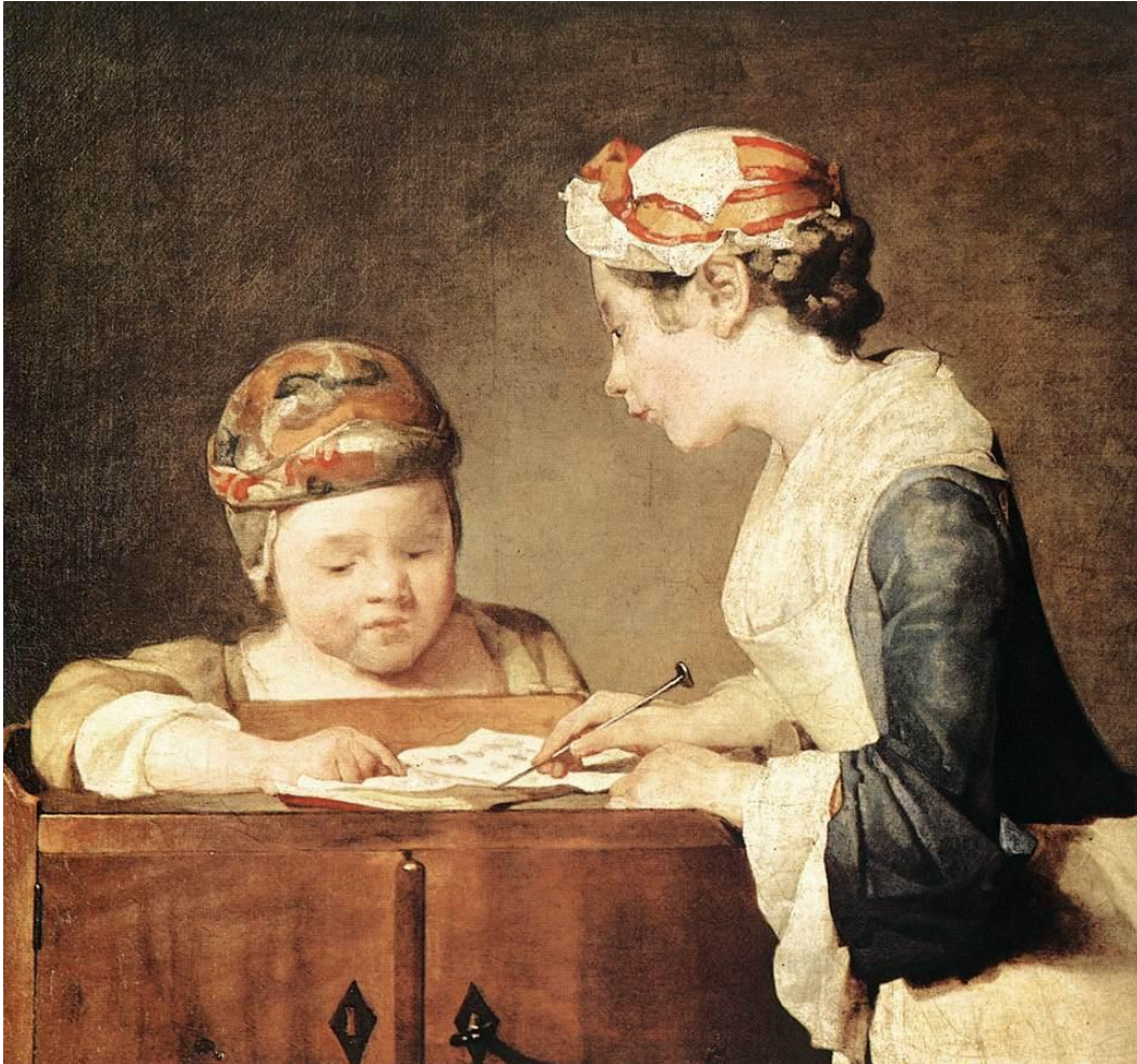
Chardin, La joven institutriz.