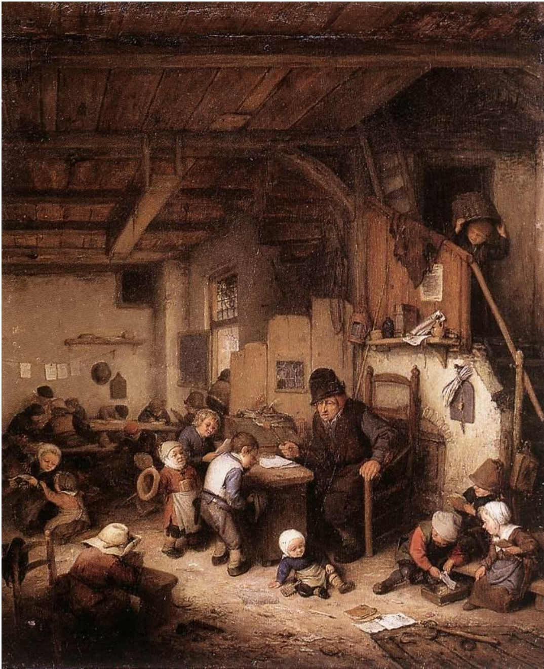
Ostade, El maestro de escuela (1662).