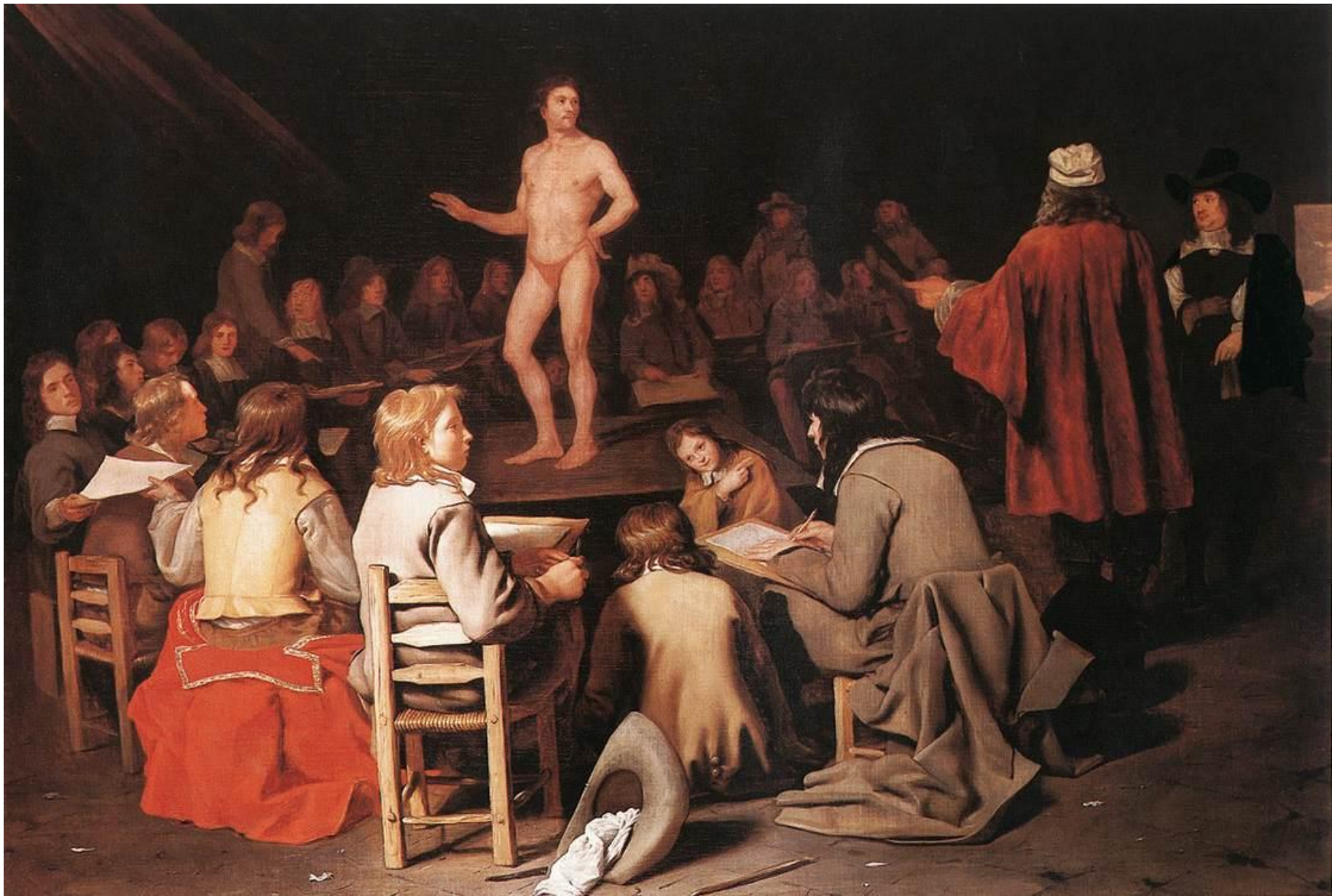
Sweerts, La clase de dibujo (1656).