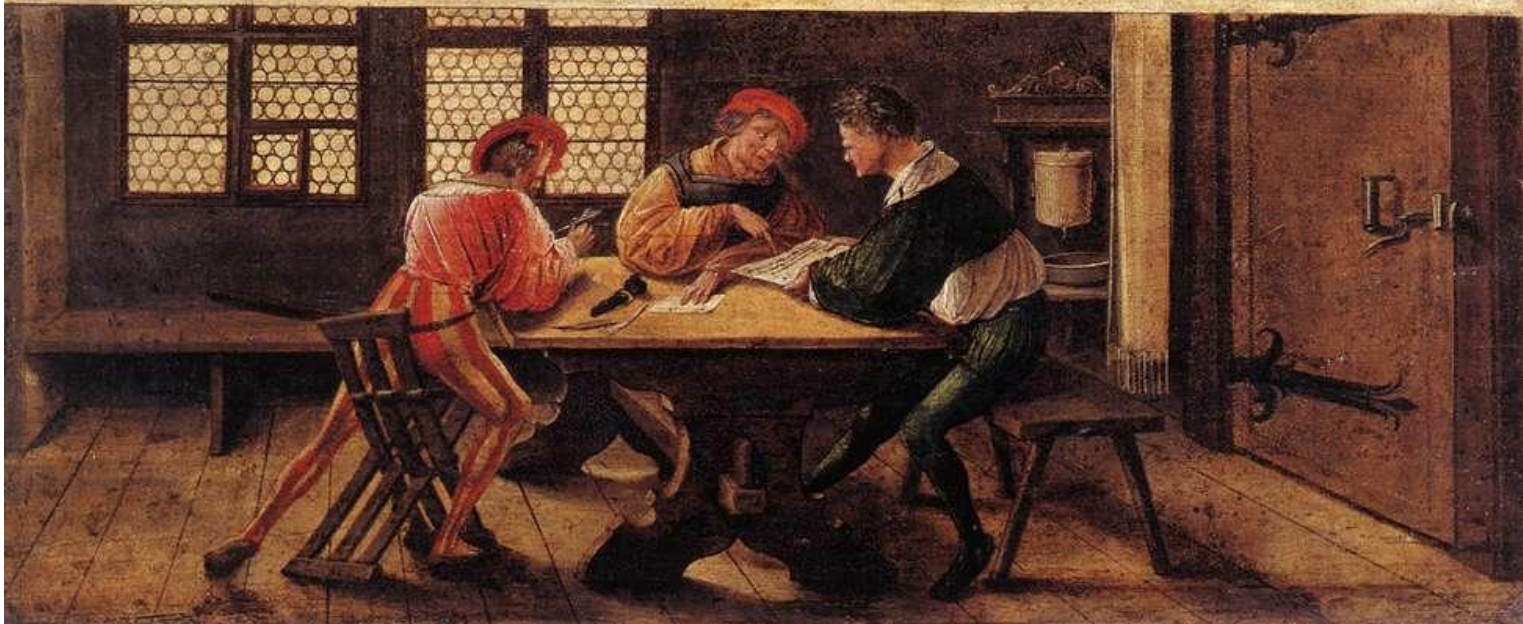
Holbein, Título de maestro (1516).

wer jemand hie der gern welt lernen durtich schreiben vnd lasen vñ dem aller kürzisten grundt den Jeman Erdencken kan do durch ein jedes der vor mit ein büchstaben kan der mag kürzlich vnd bald begriffen ein grundt do durch er mag von im selber lernen sin schuld vff schreiben vnd lasen vnd wer es mit gelernen kan so vngeschickt were Den will ich vñ mit vnd ver geben gelet haben vnd gantz nit von im zñ lon nemen er syg wer er well burger Durtich handtwerckß gesellen frowen vnd ju nckfrouwen wer sin bedarff Der kum har in der wirt druwlich gelet vñ ein zimlichen lon Aber die jungen knaben vnd meit lin noch den frounasten wie gewonheyt ist Anno m cccc xvi