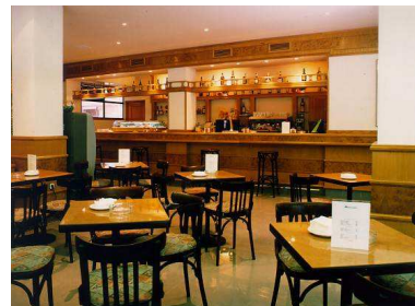
Die Cafeteria ist geschlossen .