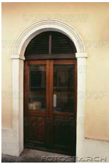
Die Tür ist geschlossen .