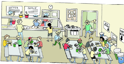
Die Cafeteria ist offen .