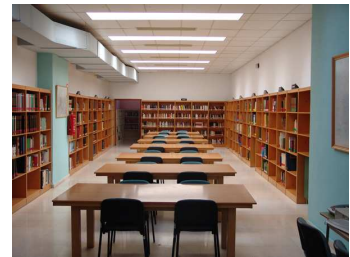
Die Bibliothek ist geschlossen .