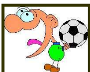
Er ist Fußballspieler von Beruf.