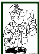
Er ist Briefträger von Beruf.