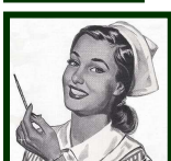
Sie ist Krankenschwester von Beruf.

ich bin Lehrerin von Beruf. du bist Hausmeister von Beruf. er ist Sänger von Beruf. sie ist Schauspieler von Beruf. wir sind Lehrer von Beruf. ihr seid Kellner von Beruf. sie sind Mechaniker von Beruf. Sie sind Techniker von Beruf.