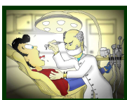
Er ist Zahnarzt von Beruf.