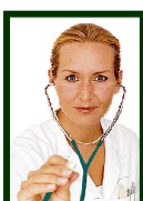
Sie ist Ärztin von Beruf.