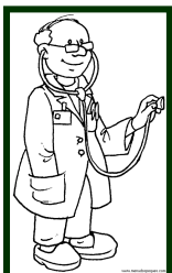
Er ist Arzt von Beruf.