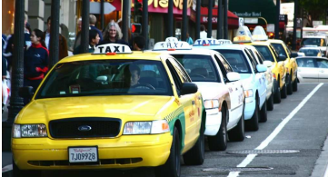
an der Taxistand