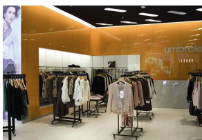
in einer Boutique