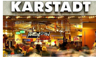
in einem Kaufhaus