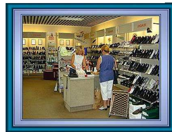
in einem Schuhgeschäft