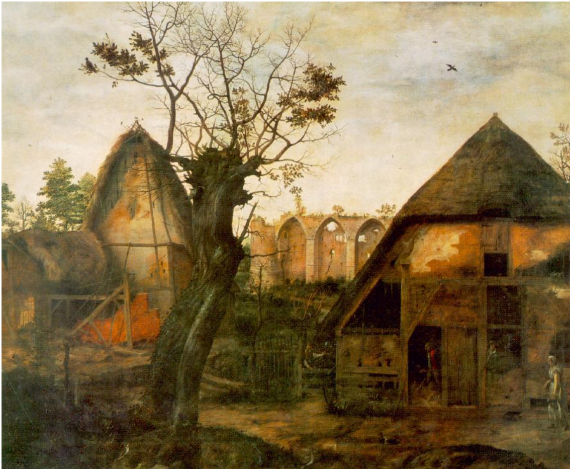
Dalem, Paisaje con granja (1564).