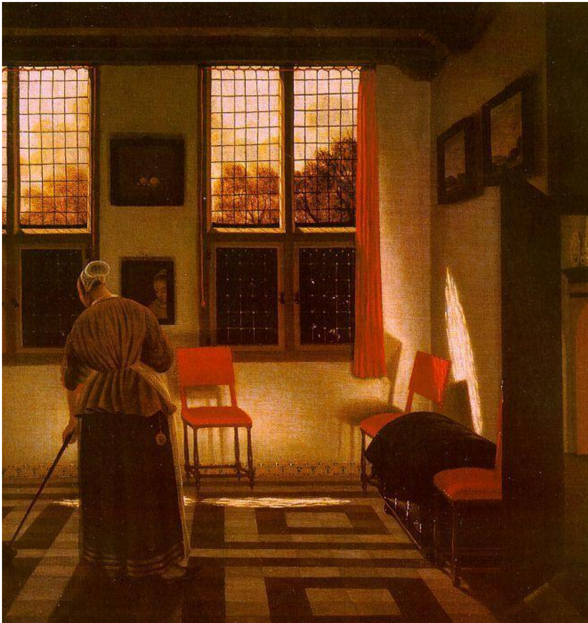
Elinga, Habitación de casa holandesa.