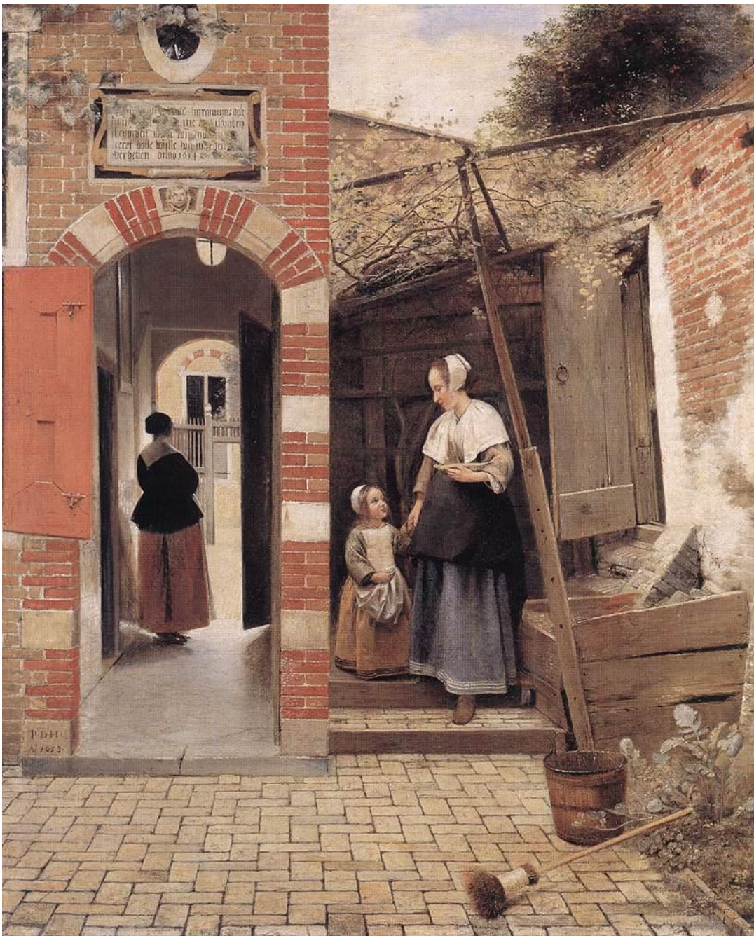
Hooch, Patio de una casa de Delft (1658).