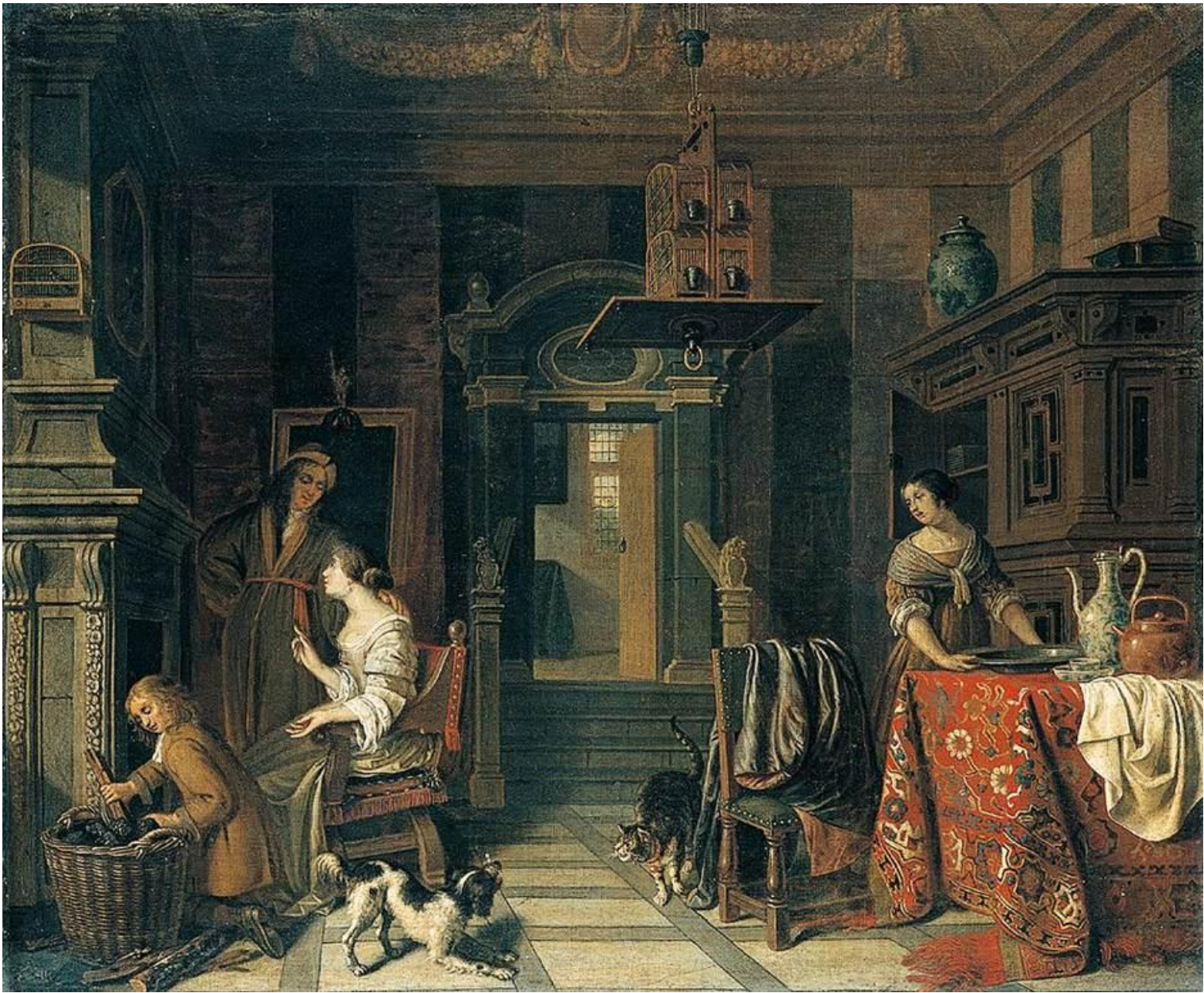
Cornelis de Man, Interior de casa de la ciudad.