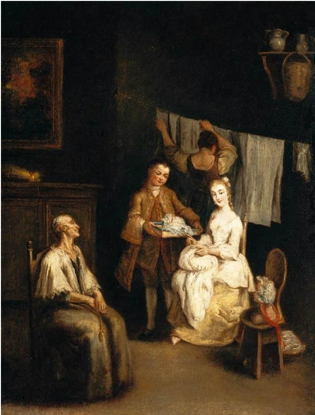
Pietro Longhi, Interior.