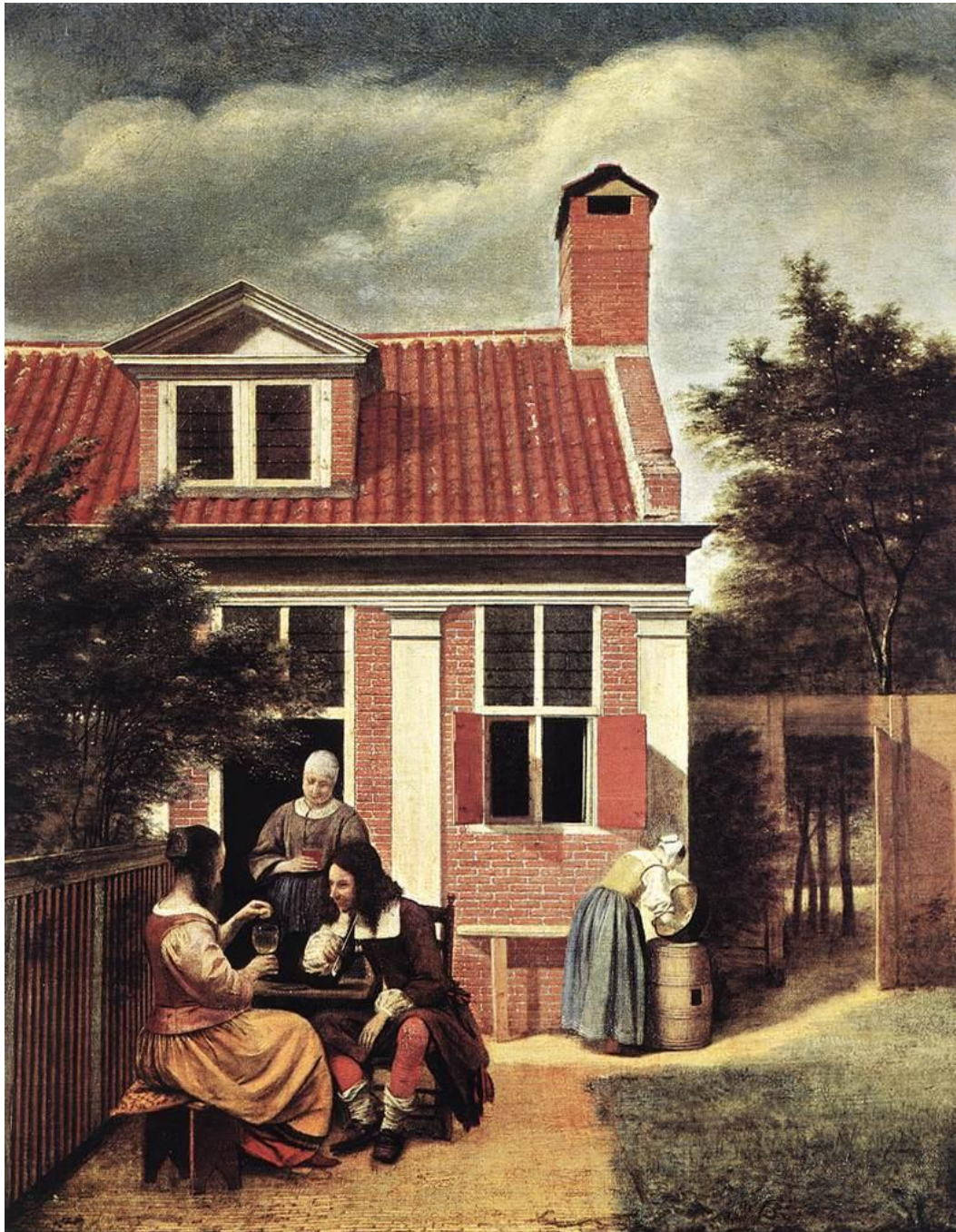
Hooch, Casa de campo (1665).