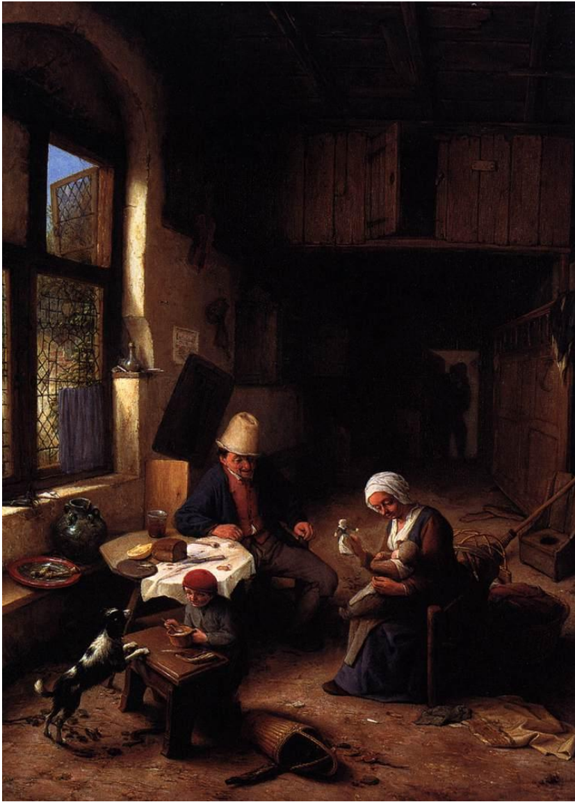
Oostade, Interior de vivienda campesina (1668).