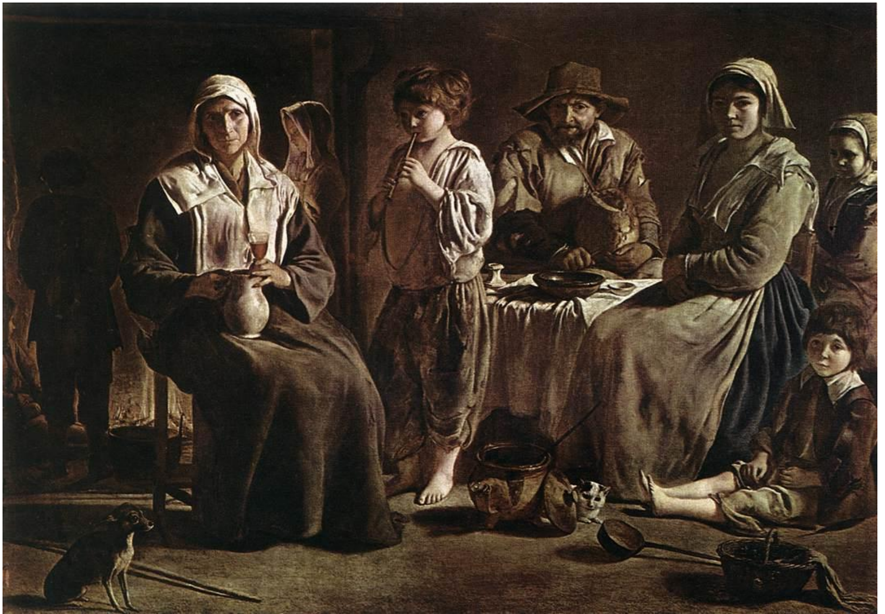
Le Nain, Familia campesina (1640).