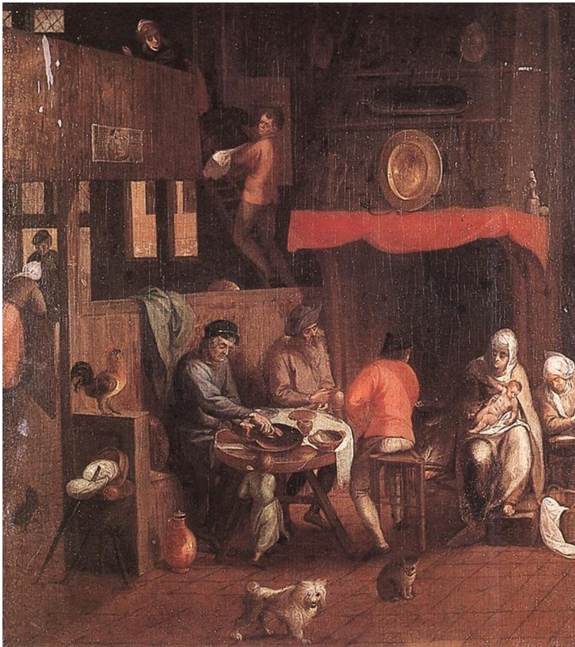
Gills Mostaert, Casa holandesa (siglo XVI).