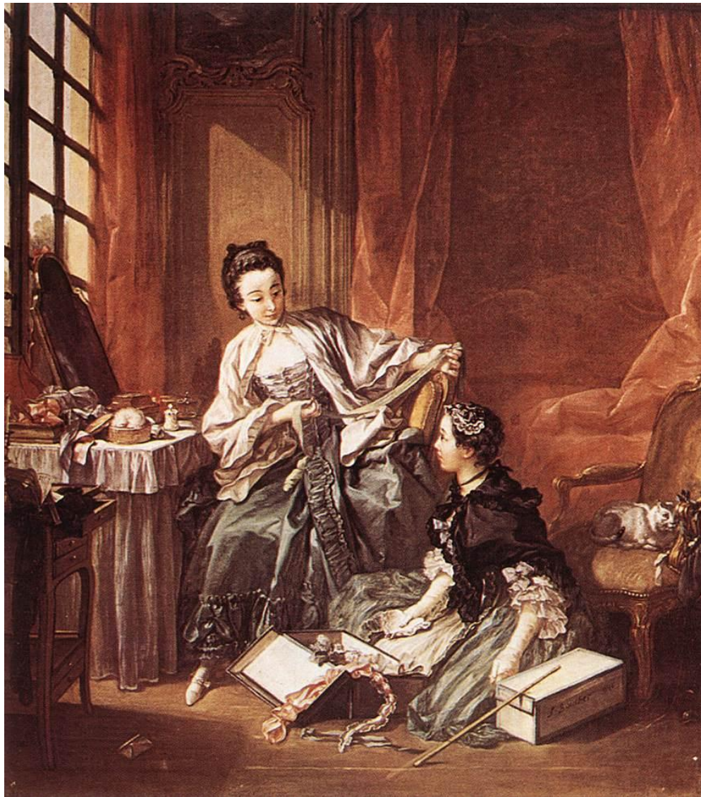
Boucher, La mañana.