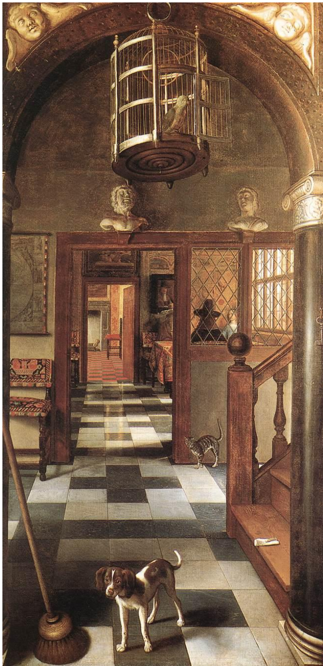
Hoogstraten, Vista del corredor (1662).