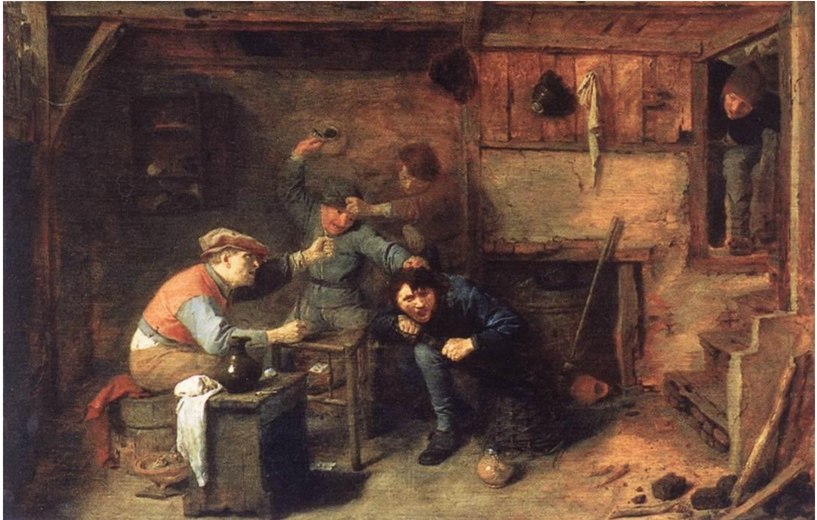
Brouwer, Campesinos peleando.