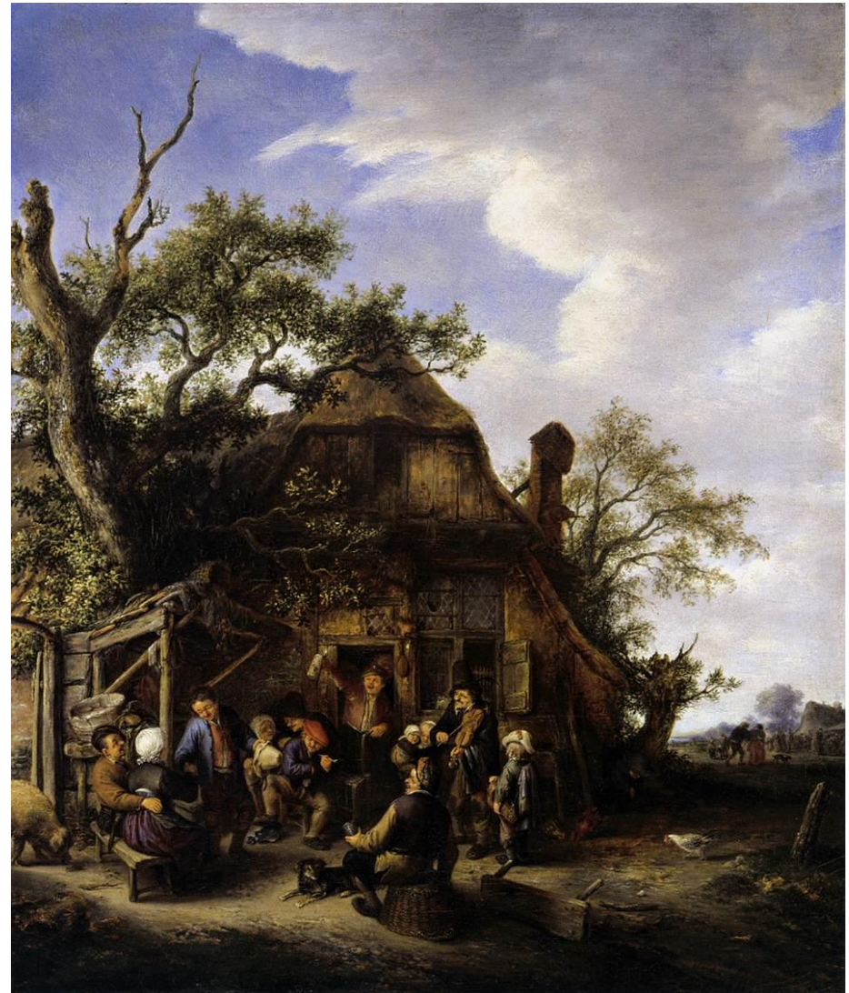
Oostade, Campesinos felices (1648).