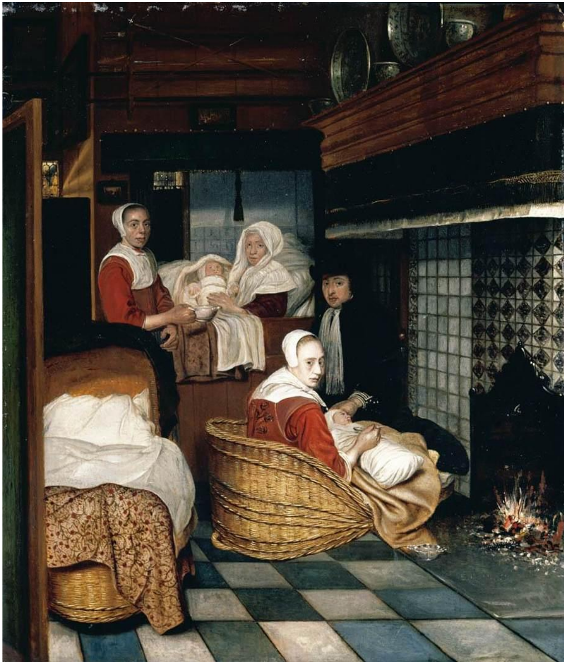
Cornelis de Man, Interior 1670.