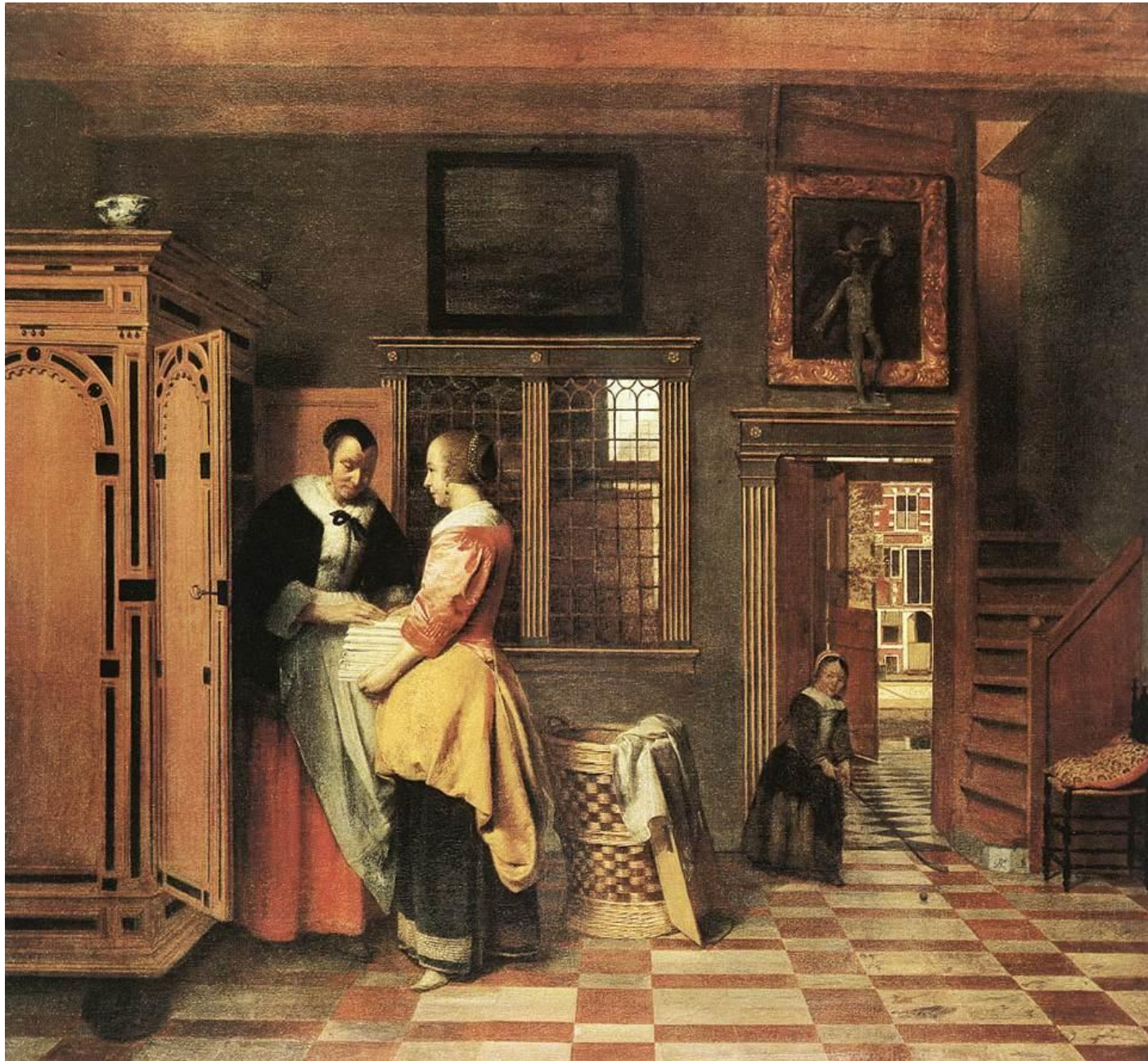
Hooch, El gabinete de los lienzos (1665).