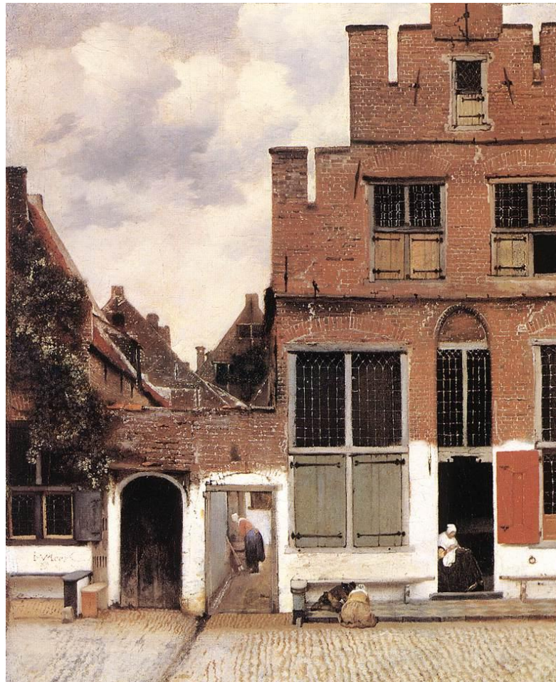
Vermeer, La callejuela (1657).