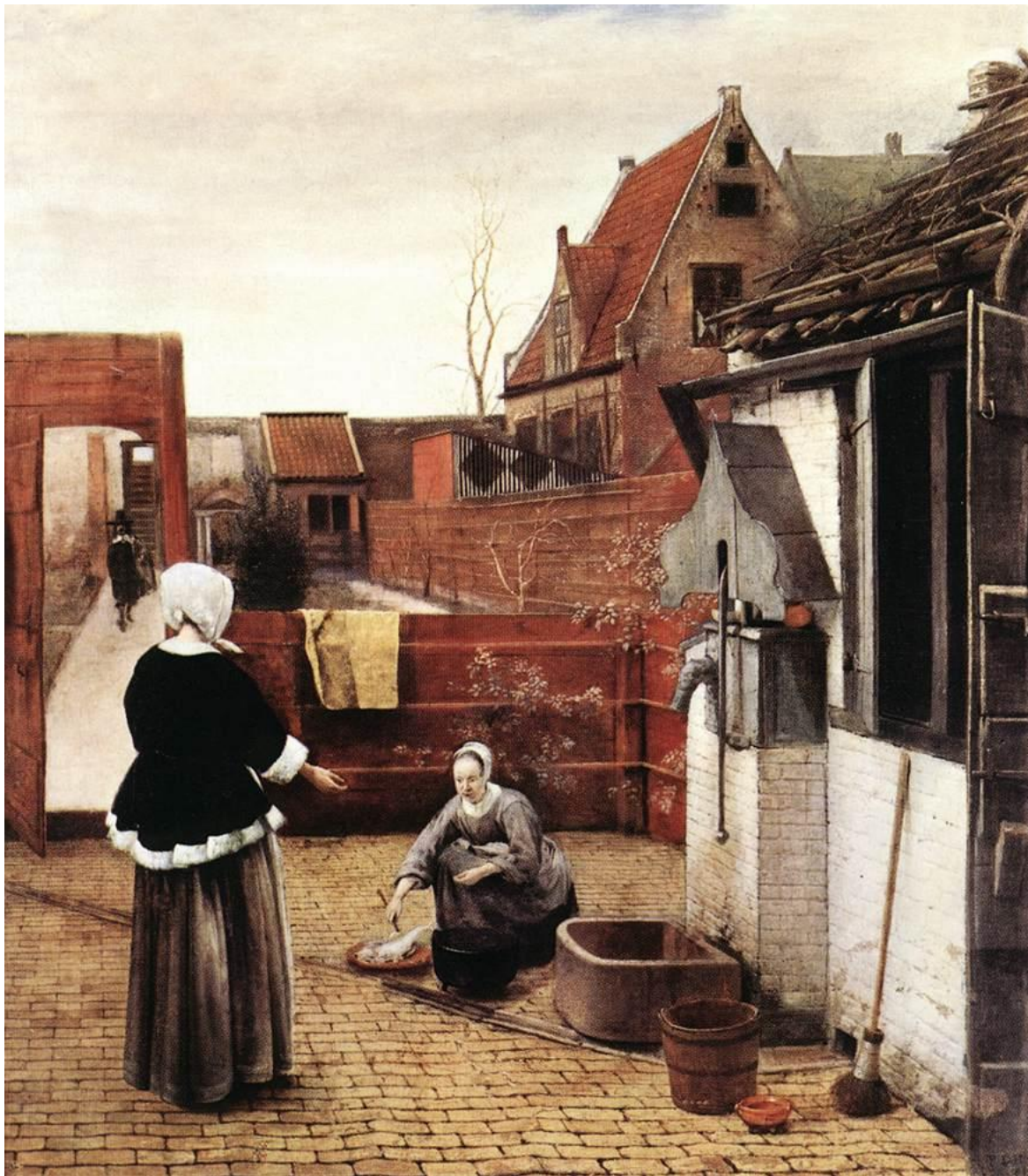
Hooch, Mujer y criada en un patio (1660).