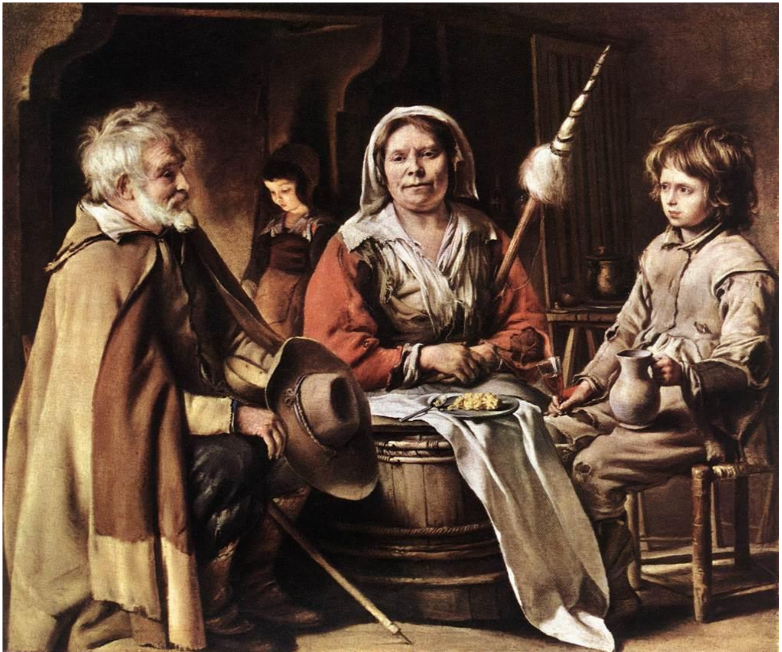
Le Nain, Interior campesino (1642).